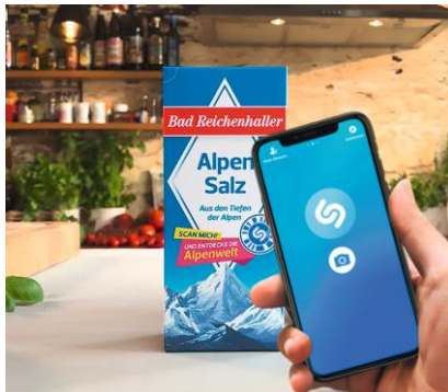
Shazam-Code auf Bad Reichenhaller Paket scannen.jpg

Die Bad Reichenhaller Alpenwelt auf eine neue Art entdecken.