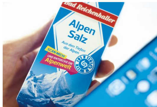
Bad Reichenhaller Paket mit Shazam-Code.jpg

Die Bad Reichenhaller Alpenwelt auf eine neue Art entdecken.